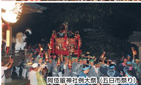
阿伎留神社例大祭(五日市祭り)