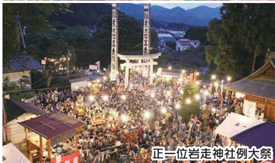
正一位岩走神社例大祭