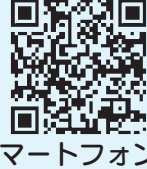
スマートフォン用

※詳しくは、図書館ホームページ ( https://www.libbraryakiruno.tokyo.jp/index.aspx ) をご覧ください。