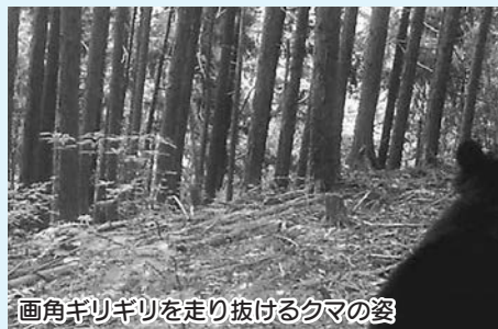
画角ギリギリを走り抜けるクマの姿

最近、西多摩でのツキノワグマの目撃情報が増えています。しかし、不思議なことに市内では、目立った目撃情報はありません。市内にも爪痕やフンなどの痕跡が数多く見られることから、間違いなく生息しています。そのため、都では、毎年7月、8月に市内の山林にも複数台のセンサーカメラを設置してツキノワグマの生息調査を行っています。