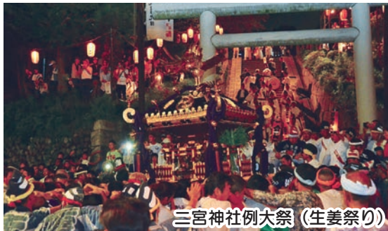
三宮神社例大祭(生姜祭り)