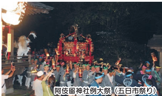
阿伎留神社例大祭(五日市祭り)