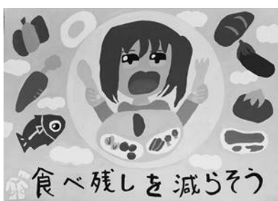
平成29年度 小学校5年生の部 最優秀賞受賞作品