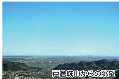
戸倉城山からの眺望

○アクセス ・戸倉城山…西戸倉バス停から山頂まで徒歩約50分 ・金比羅山…武蔵五日市駅から山頂まで徒歩約60分 ○問合せ 観光まちづくり推進課観光まちづくり推進係(☎595-1135)