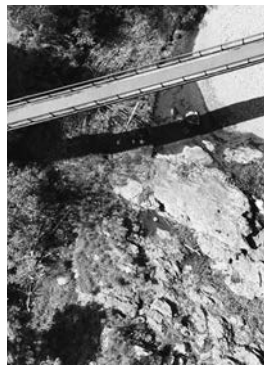
石舟橋上空 市では、シテイプロモーション