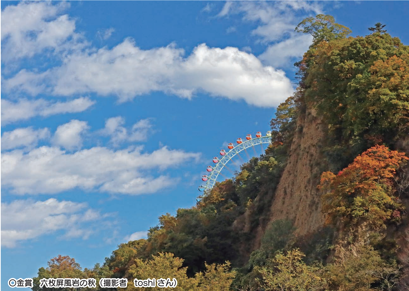
◎金賞 六枚屏風岩の秋