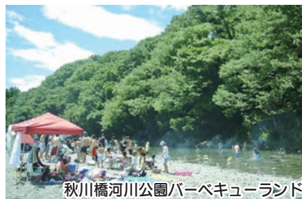
秋川橋河川公園バーベキューランド

流れが穏やかな秋川で水遊びを楽しみながらバーベキューを楽しめます。器具はレンタルなので、お手軽にバーベキューができます。