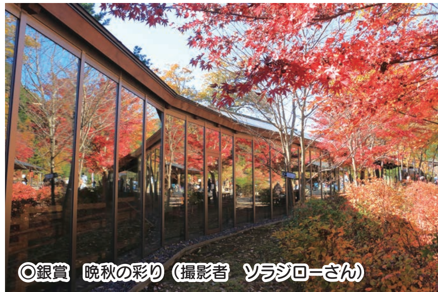
◎銀賞 晩秋の彩り