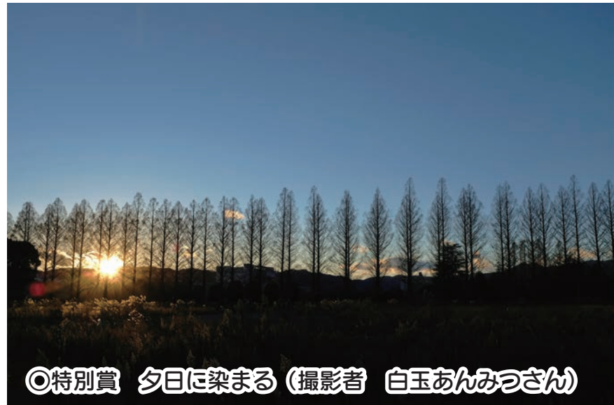
◎特別賞 夕日に染まる