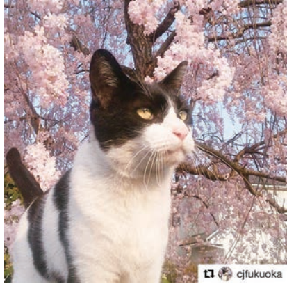
cjfukuokaさんに「#るのびと」をつけて投稿いただいた写真