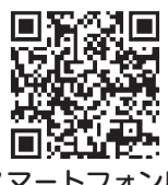
スマートフォン用