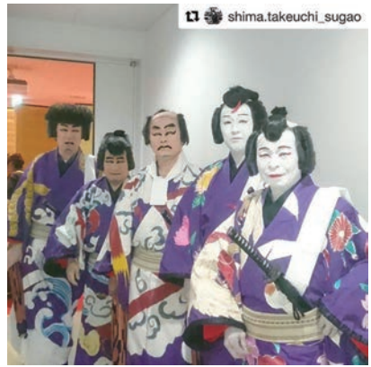
shima.takeuchi_sugaoさんに「#るのびと」をつけて投稿いただいた写真