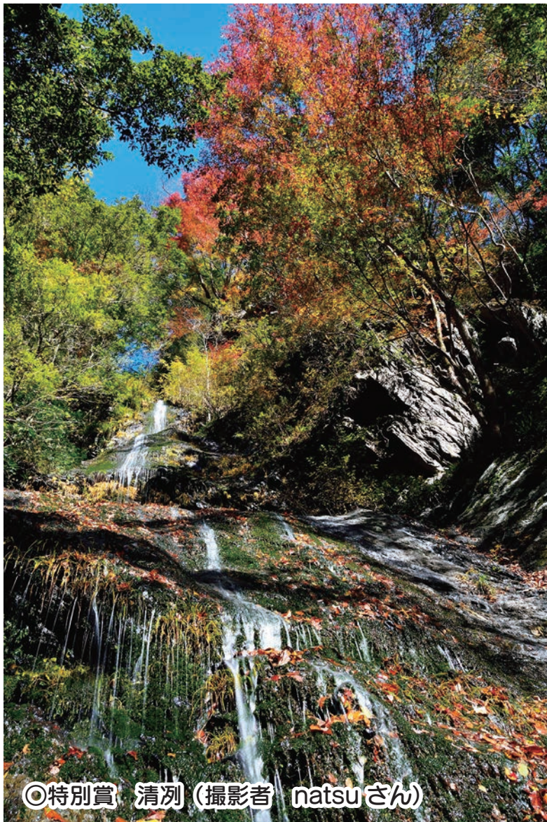
◎特別賞 清冽