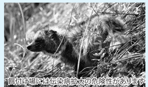
餌付け場には伝染病拡大の危険性があります

私が学生のころ、スペインの実家の大きなテラスで、父が多くの植物を育てていました。そこには、たくさんの昆虫や鳥類が集まり、乾燥した時季でもにぎやかで、小さなオアシスになっていました。また、実家はマンションの最上階だったので、屋根を隠れ家に使っていた昆虫の名ハンターであるヤモリの群も暮らしていました。ときには、チョウゲンボウなどの猛禽類が小鳥を捕食していました。食物連鎖は完璧にできあがっていたと思います。私は、観察することが好きで、2年にわたるヤモリの個体識別調査などをやりました。