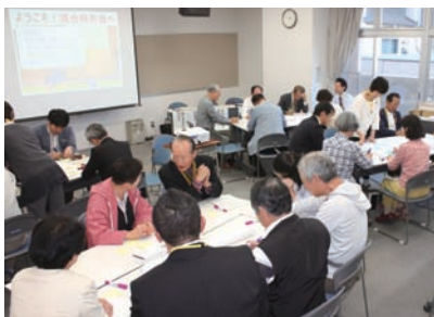
前回の議会報告会の様子