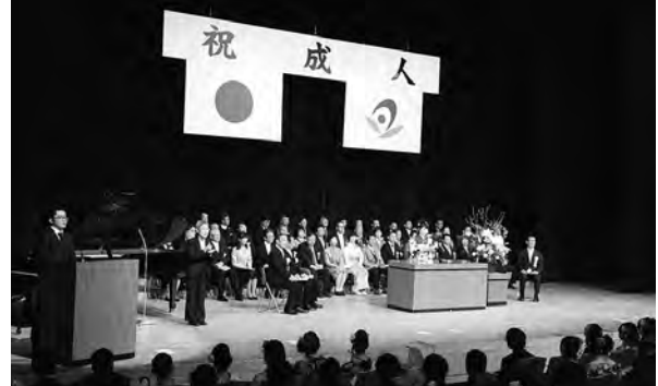
未来を築く成人の門出を祝し