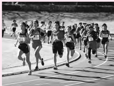
・日の出町・檜原村)子ども体験塾実行委員会