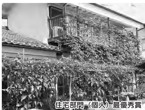
住宅部門(個人)最優秀賞

あきる野市環境委員会が、景観や設置の効果などを審査し、受賞者を決定の上、産業祭で表彰しました。▽受賞者