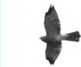
サンバの群れに交じってあきる野を訪れたアカハラダカ雌個体

ました。市内に一時滞在したかは不明です。アカハラダカは、市内で初確認となるだけでなく、東京都でも初めて正式に記録されると思われます(公開されている「日本野鳥の会奥多摩支部」「八王子・日野カワセミ会」のタカの渡り調査記録による判断)。確認したのは、台風18号が通過した翌日の9月19日でした。台風の影響でルートを変更した可能性があります。結果、あきる野市と全く縁のないはずの小さなタカに出会うことができました。私には、この個体があきる野を中間地点として、繁殖地と越冬地を結びつけたように感じました。やはり、この地球は一つであることを忘れてはいけません。(パブロ)