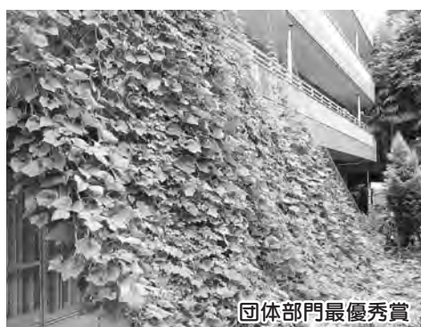
団体部門最優秀賞