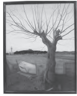
第5回絵画展最優秀作品「夕映」