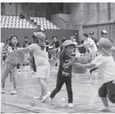
「あきる野市障がい者防災・スポーツフェア2017」防災運動会の参加者募集

▽内容 みんなで火を消せ！バケツリレー「協力してバケツリレーで初期消火の体験を行います(4人～16人で申し込んでください)」。