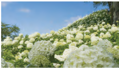
平成28年度「春・夏の部」受賞作品