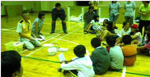
◆作り方の説明です

◆ランタン作りの材料は、コップ・アルミホイール・ティッシュそしてサラダ油が少々で作ります。 また、ヒックリ返っても発火点が高いため、燃え広がらないとか。