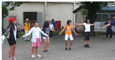
◆6時30分 みんなでラジオ体操