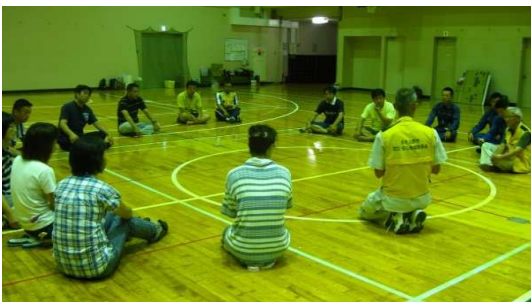
◆まずは、点呼(安否確認?)