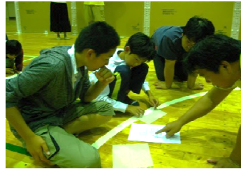
◆マニュアルをよく読んで～