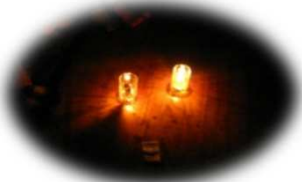
電気を消したら・・・