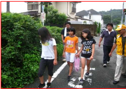
◆みんなでごみ拾い