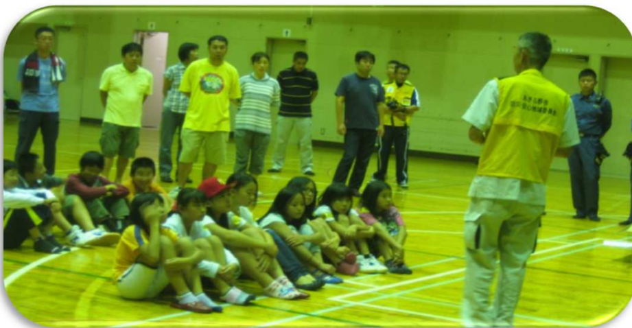
◆会長より今夜の予定や注意点の説明