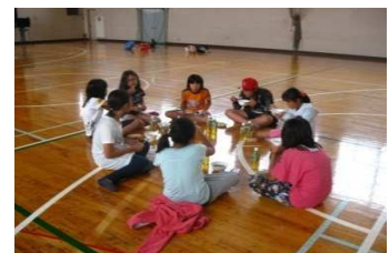
◆丸くなって、いただきま～す！