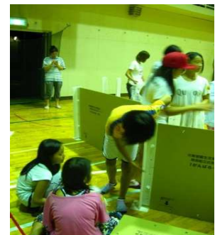
◆コツが分かれば・・・