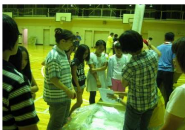
◆作り方をよく聞いて・・・