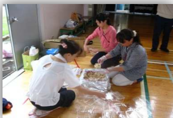
◆アルファ米は結構～あつい！