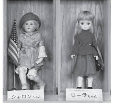
の思い出話(3日・4日)

旧戸倉小学校に保管されていた友人形(シャロンちゃん、ローラちゃん)の常設展示を記念して、歓迎会を開催します。 ▽日時 5月3日(水)5日(金) 午前10時～午後5時 ▽場所 戸倉しろやまテラス2階メモリアルラウンジ ▽内容 ●「友人形」解説とDVD「青い目の友人形シャロンちゃん」上映(4日・5日)：午前11時、午後2時 ●「友人形」シンポジウム：友人形にゆかりのある方々