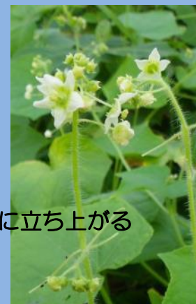
葉の上に立ち上がる