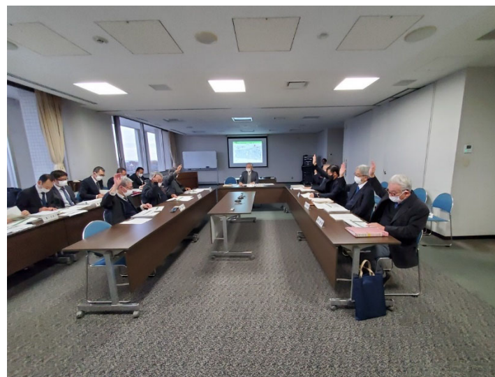
写真 土地区画整理審議会の様子

令和4年12月5日(月)あきる野市役所にて、第24回土地区画整理審議会を開催いたしました。