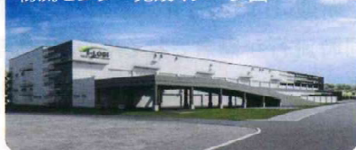
物流センター完成イメージ図

見込み、宅地造成は本年度中に約57%、道路築造は約55%完了予定となっています。