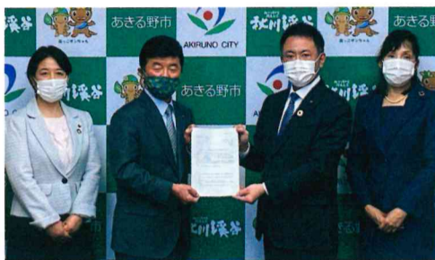
市長に対し緊急要望書を提出(2021年2月)