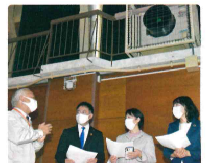
体育館のエアコン設置状況を視察