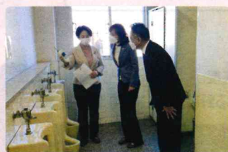
現地調査するあきる野市議会公明党

今回は「臭い検査機」をレンタルして、どこから強い臭いが発生しているのかを調査しました。併せて、蛇口、石鹸の種類、除菌用アルコールの設置状況、トイレ窓の開閉、換気扇などについても調査しました。