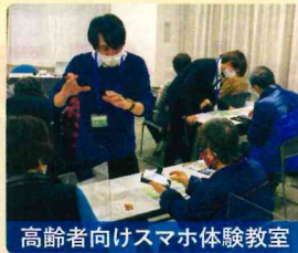
高齢者向けスマホ体験教室

市では、これまで中央公民館主催の初心者向けスマホ体験教室を開催していますが、小さい単位でのスマホ体験教室を無料で、開催回数を増やすべきと提案しました。