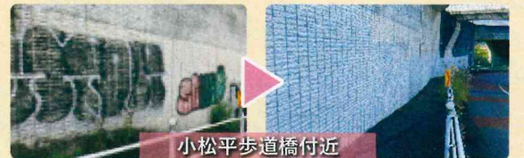
小松平歩道橋付近