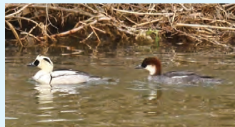
あきる野で見られるミコアイサ(左:雄、右:雌)

冬にあきる野の河川敷を訪ねると、さまざまなカモの仲間を観察することができます。一年中見ることできるカルガモやオシドリ(留鳥)以外に、冬鳥としてキンクロハジロやオナガガモ(渡り鳥)などが飛来します。私は、飛来するカモの種類や羽数が年々減少している印象を受けてきたため、昨年からカモ(ガンカモ類)のカウントを始めました。普通種であるコガモやマガモなどの個体数は減少し、かつて確認していたカワアイサやスズガモ、ホオジロガモ、オカヨシガモなどが見られなくなっています。