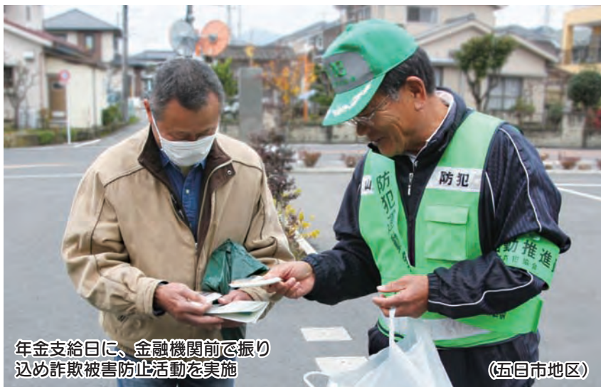
年金支給日に、金融機関前で振り込め詐欺被害防止活動を実施

福生警察署管内防犯協会の活動範囲は、市内の旧秋川市地区(秋川支部)、福生市、羽村市、瑞穂町です。秋川支部では、町内会・自治会から選出された「防犯活動推進員」と「女性防犯指導員」が活動をしてい