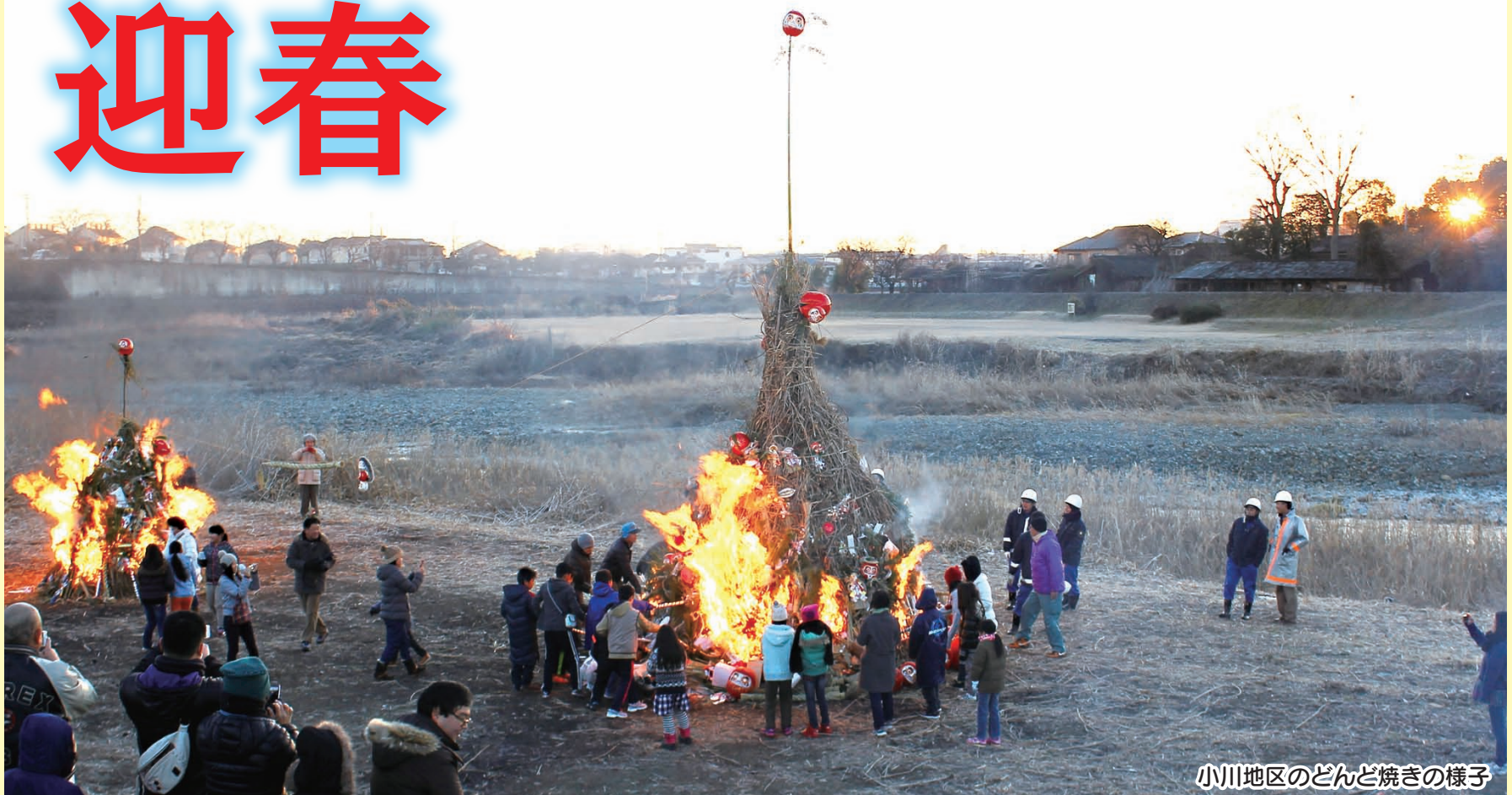
小川地区のどんど焼きの様子

時代の流れとともに、実施日や場所などその姿は変化していますが、天高く燃え盛る炎を取り囲みながら、地域の人たちが心をつなげて無病息災を祈る光景は、今も昔も変わらないあきる野市のお正月の風物詩です。これからも永く受け継いでほしい、地域の貴重な伝統文化です。