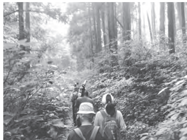
自然散策体験(イメージ写真)

※日帰りの体験可 ※体験プログラムの料金・人数については別途お問い合わせください。