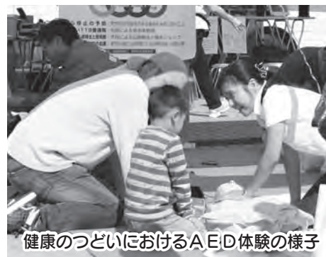
健康のつどいにおけるAED体験の様子