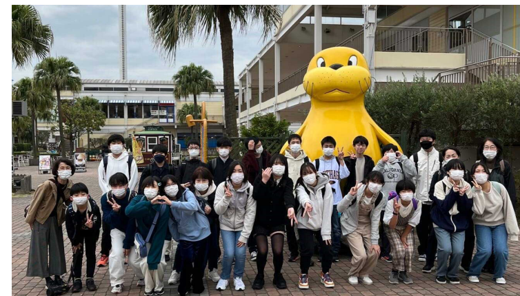
八景島シーパラダイスへの遠足