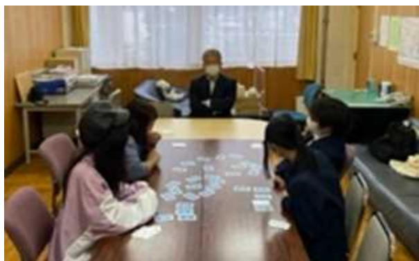
相談員や子ども同士で カードゲームで交流