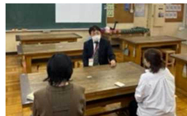
相談員に保護者が進路 の相談