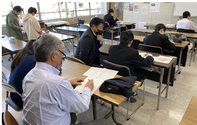
個人学習と指導員の支援