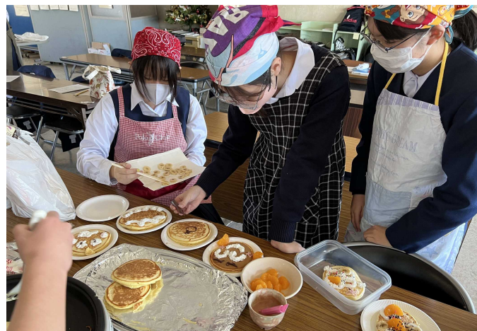
お楽しみ会での調理