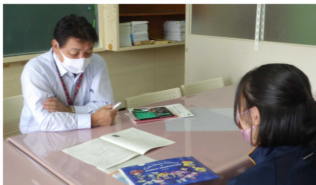
相談員に生徒が学習の 相談