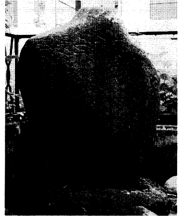
酒匂川に建つ文命西堤碑

特に宝永4年（1707）の富士大噴火 では、降灰で河床 が埋まり、翌年の 大雨では大泥流と なって下流21カ村 に大きな被害をお よぼし、さらに享 保2年の洪水でも 沿岸村々に大打撃 を与え、荒廃がま すます進んでいま した。幕府も手を こまねいていたわけではなく、改修工事を繰り返してき たのですが、一夜の大雨で破壊されてしまうという、そ の繰り返してした。