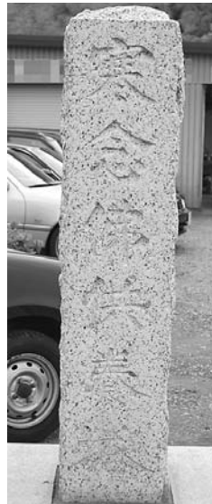
市内で最も新しい寒念仏塔、折立、大正7年(1918)

あきる野市は江戸時代・明治時代を通じて寒念仏の盛んなところで、元禄11年(1698)から、大正7年(1918)までの寒念仏塔が73基残っています。私が確認した範囲では、あきる野市よりずっと広い土地を持つ青梅市ですら25基、八王子市では12基に過ぎません。また、寒念仏を行う村人たちの集まりである寒念仏講中の活動が極めて活発で、神社に灯籠や手洗石を寄進したり、交通の安全を願って馬頭観音を立てたり、庚申待を行って庚申塔を建てたりしています。73基のうち32基(40%強)がそのような寒念仏講中によって建てられた馬頭観音や庚申