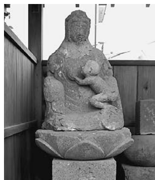
③小川・地蔵堂の鬼子母神

人間の子供をさらって食べるインドの鬼神。お釈迦様に教え諭されて子どもの守り神となりました。天保10年(1839)。