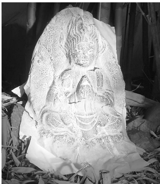
草花・森山の1面2手坐像の馬頭観音（拓本採取中） 造立年不明、憤怒相、明王馬口印を結ぶ

また、1面2手の立像が圧倒的に多い中、市内には1面2手の坐像が2基有ります。1面2手坐像は多摩地区では私の知る限りでは、隣の日の出町に1基、松原村に1基、青梅市ですら1基を数えるのみです。館谷の正光寺と森山の岸野家の2基です。特に後者は珍しい憤怒相で、貴重なものです。