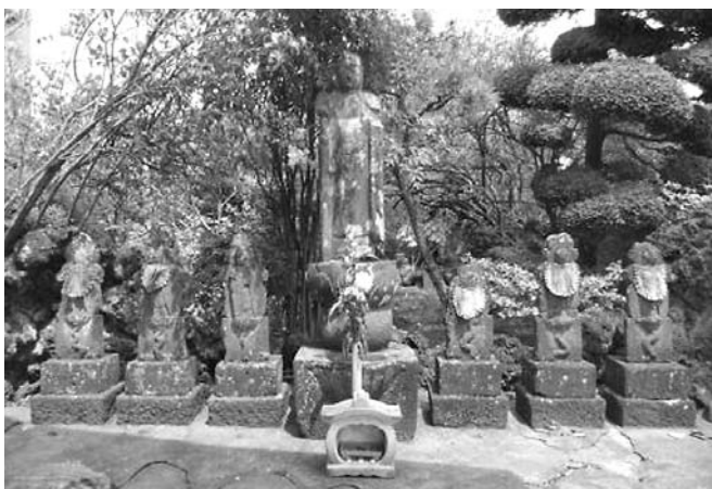
油平・福德寺の五輪光背六地蔵、安永7年(1778)

また、油平・福德寺の五輪地蔵は他の五輪地蔵と違う特徴を持っています。他の五輪地蔵が舟形光背といって、舟の形をした光背を持ち、その中に五輪塔が浮彫りされているのに対して、この福德寺の五輪地蔵は舟形光背ではなく、板状の五輪塔を光背としています。しかも単体の地蔵ではなく六地蔵です。きわめて稀少、貴重な石仏です。