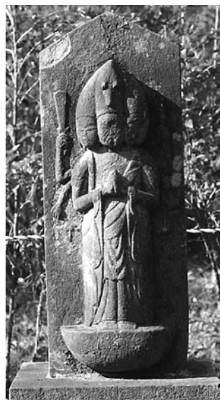
菅生・路傍、3面6手立像 造立年不明

私たちがよく目にする馬頭観音は、1面2手立像の温和で慈愛に満ちたお顔をしています。それは、