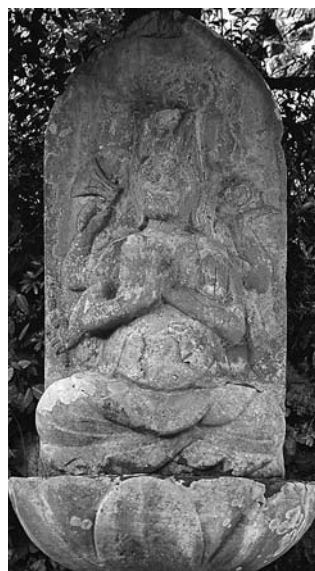
市内在銘最古 宝暦14年（1764） 1面6手坐像 五日市・開光院

馬頭観音は馬が まぐさ 林をむさぼり食うように、私たちの無知や欲望や罪の原因である煩惱を食い尽くしてくれる仏様として信仰された変化観音の一つです。観音様は衆生（すべての生きとし生けるもの）が現に生きており、死後生まれ変わる地獄・餓鬼・畜生・修羅・人界・天界の六つの世界（六道）に、六種の観音（六観音 聖・千手・馬頭・十一面・准提または不空罽索・如意輪）として姿を現し、その世界の衆生を救い導くと言われます。その中の畜生道を担当したのが馬頭観音で、頭の上に馬頭を頂いているのが特徴です。本来の馬頭観音は私たちの煩惱（心の中の悪魔）を退治する仏なので、怖い顔をしています。そしてその力の大きさを表すために、顔を三つ持っていたり、手も6本や8本あり、斧や剣などの武器を持った姿で表わされたりします。五日市・開光院の1面6手の坐像は ふんぬそう 憤怒相で本来の馬頭観音の姿を最もよく表していると思います。