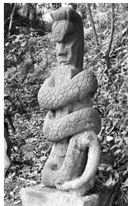
⑤代継・白滝神社の俱利伽羅不動

不動明王のシンボルである剣を飲み込もうとする竜。白滝神社の横を流れる湧水の守り神(水神)として祀られています。