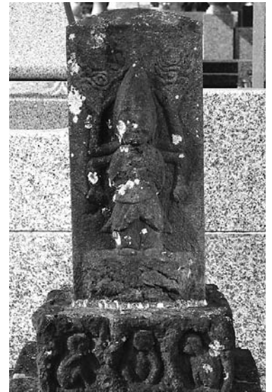
瀬戸岡村寒念仏講中によって建てられた庚申供養塔、宝暦13年(1763) 瀬戸岡・朱陽院参道横

塔や灯籠などです。厳寒の中を30日間も修行と言ってもよいような行をやり通すほどの人たちですから、村の生活のさまざまな場面で、力を発揮したのでしょう。