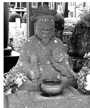
④小川・慈眼寺の閻魔大王