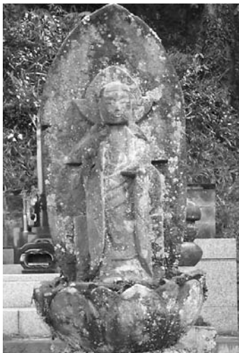
横沢・大悲願寺の五輪地蔵 (菊淵房塔)

ノ院の汗流地蔵尊を模写したものだ」と記しています。多摩地区の10基の五輪地蔵は大悲願寺の影響下で作られたものと考えてよいでしょう。その意味で五輪地蔵はあきる野市を特徴づける石仏と言えるでしょう。