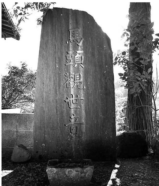
五日市地蔵堂前の文字馬頭観音

また、1面2手の立像が圧倒的に多い中、市内には1面2手の坐像が2基有ります。1面2手坐像は多摩地区では私の知る限りでは、隣の日の出町に1基、松原村に1基、青梅市ですら1基を数えるのみです。館谷の正光寺と森山の岸野家の2基です。特に後者は珍しい憤怒相で、貴重なものです。