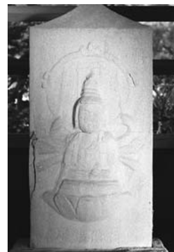
②瀬戸岡・朱陽院・弁才天 享保12年(1727)