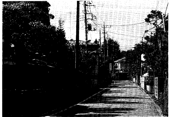
現在の二宮(北宿通り)の風景

父 お前も口が悪いね。一行は御上3名、御分家4名、女中7名、他に御家来衆とその家族、御門番、馬屋衆まで、計35名。菩提寺室清寺では手狭なので、法林寺に移り、4月6日まで とろりゅう 逗留の上、江戸へ引揚げられた。費用計655貫文(約65両)は例の知行三村で高割にして分担している。文書には「いずれ年貢収入のうちからお支払いいただく筈」と書いてあるが、この期待も空しかったわけだ。