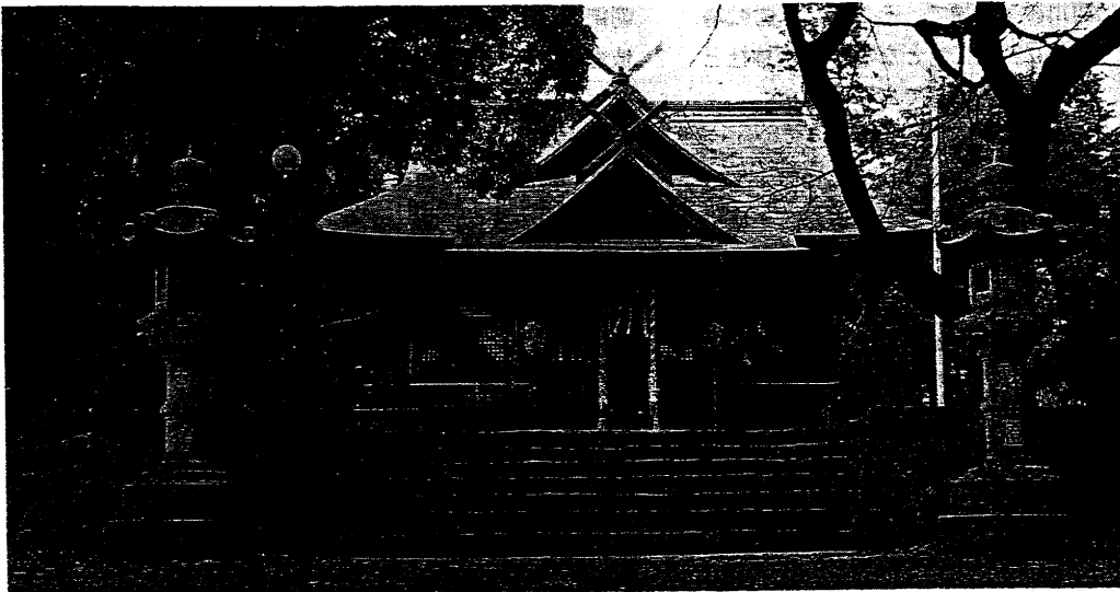
阿伎留神社 あきる地名の起源 とみられる