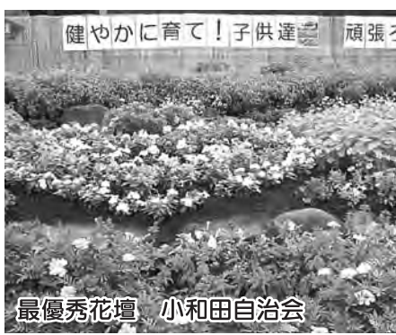
最優秀花壇 小和田自治会

コンクールには、15花壇の応募がありました。7月18日に審査会を開催し、植え付け方、手入れ状況などの現地調査を行い、最優秀花壇、優秀花壇、優良花壇、努力賞を選出しました。