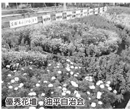
優秀花壇 油平自治会