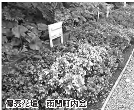
優秀花壇 雨間町内会