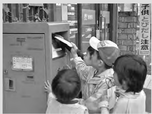
山登りの思い出を自分宛にポストへ