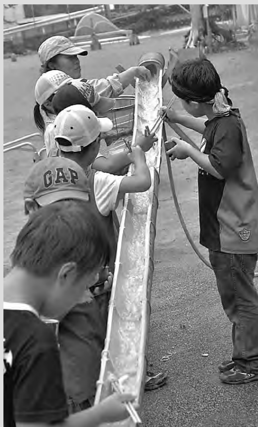
切り出した竹で流しそめん

山の頂上で「つぎのたいけん学校でやりたいことはありますか」と言われたので、ほくは「ながしそめんをやりたい」と言いました。なん曰かたって電話がかかってきました。「竹をもう一人お手紙をかってほしいと。前にケノコをほらせてもらったおしさんに「こんどは竹を切らせてください」とおねがいの手紙をかってポストにいれました。 ながしそめんの曰、てがみをだしたおしさんがまわって来てくれました。やさしいおじさんだったのでよかったです。おじさん、太い竹はなかなか切れませんでした。ながしそめん竹をとまらと手で学校まで運びました。竹をわろのは大人で、ほくたちはふしとんかちでとりました。もつ一本の竹でうづわとはしをつりました。 前からやりたかったながしそめんをじぶんたてでつづけた竹でできたうづわしかなかった。たのしかったです。またやりたいです。 かわくほ りょう (市内小学校2年生)