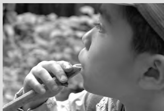
山登り、イタドリで笛を作る