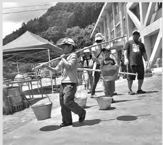
ドラム缶風呂へ水運び