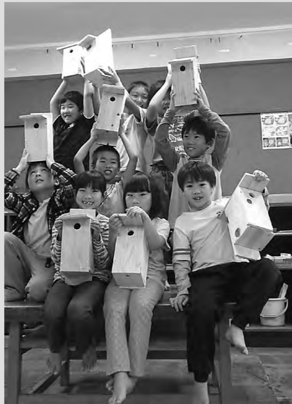
小鳥が来るかな、巣箱作り