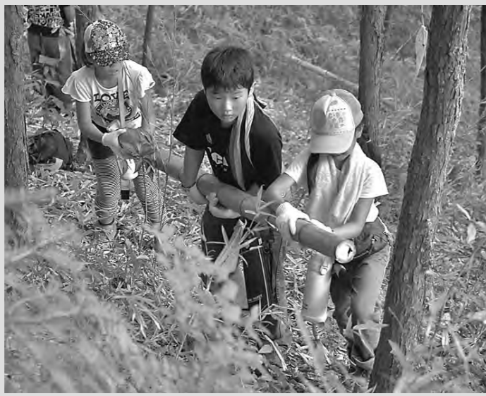
材料「竹」を切り出す