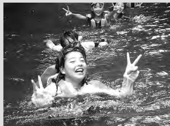
やった！激流を下り終えて