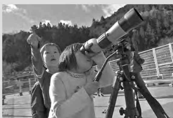
学校の屋上で野鳥観察