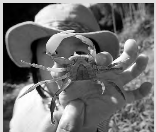
見つけたサワガニ