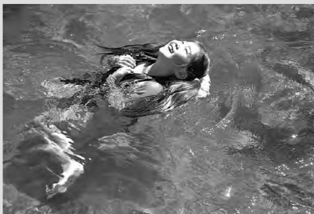
宇宙ってこんな感じかな？