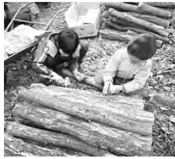
親子で里山体験「椎茸の駒打ち」里山遊び

市では、「あきる野管生の森づくり協議会」を設置して、産学官が連携して郷土の恵みの森づくりを進めており、地域に残された雑木林の手入れなどにも取り組んでいます。