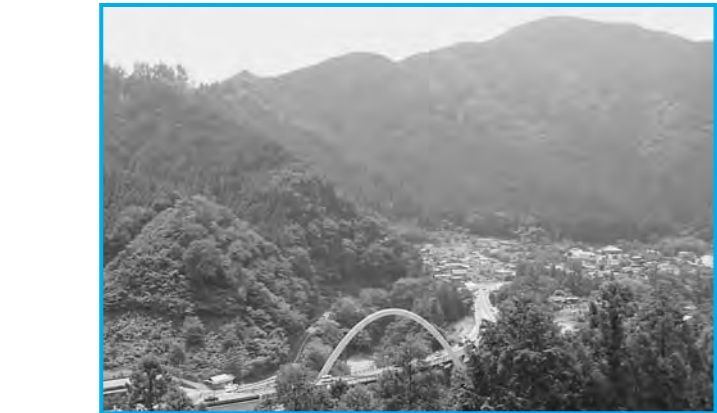
長岳尾根から見る新矢柄橋方面の眺望

ミンコイ 環境省レッドリストによる絶滅危惧種で、生息数は世界で約1000羽と推定される希少な鳥類ですが、生息環境が人目に付きにくく、生態などは不明な点が多くあります。名前は、溝にいたる律令制の五位の色(緋色)を指していることに由来するといわれています。春にフイリピンなど南方から渡ってきて夏にかけて繁殖します。沢筋のうっそうとした森に営巣し、市内でも数か所の繁殖地が確認されています。天敵から身をを守るために、長い首を伸ばし、枯れ枝などに擬態します。