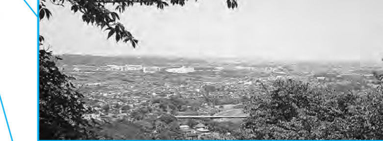
網代弁天山から見る増戸、西秋留方面の眺望

クマタカ 環境省レッドリストによる絶滅危惧種で、種の保存法に基づき国内希少野生動植物種に指定されています。大型のタカでトビよりも大きく(市内で最大の猛禽類)、森林内に生息する多種類の動物を獲物とし、森林生態系の頂点に位置しています。全国的につがいの繁殖率が急激に減少しており、絶滅が危惧されています。翼を広げた長さ(翼開長)は160~170センチ程度にもなります。市内西部山地で、稀に上空を旋回している姿が見られます。