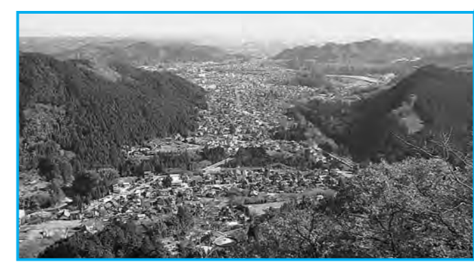
城山山頂から見る五日市、増戸方面の眺望

今ご紹介した動植物は、これまでに確認された中のごく一部です。市内には入り組んだ地形に多様な森が存在し、その地域特性にあった生態系が形成されています。市では、森林レンジャーあきる野と市民で組織するあきる野市自然環境調査部会で、市内の動植物の分布状況などを調査しています。市内の動植物の「あきる野市自然環境調査報告書」としてまとめ、ホームページや市内の各図書館などでご覧いただけます。あきる野市自然環境調査部会では、「一知だけ守るうあきる野の自然」を発行するとともに、あきる野の自然について、市民向け報告書を作成中です。▽問合せ 環境政策課環境政策係、環境の森推進係