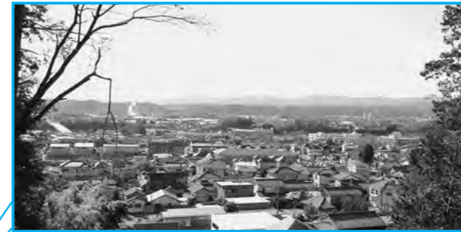
草花神社境内から見る多西、東秋留方面の眺望

市では、人と森との関わりを再認識して、将来にわたって持続的に「森の恵み」を生み続けられる新たな共生を目指して、尾根道・昔道の再生や景観整備、自然体験活動など、「郷土の恵みの森構想」を基にした森づくりを進めています。10年後、50年後、そして100年後も、人と森が共生する「環境都市あきる野」の実現を目指して。