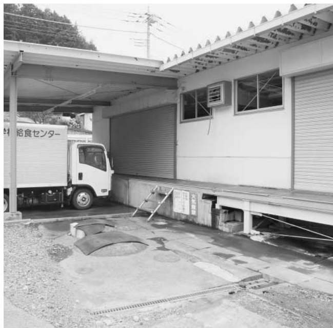
五日市学校給食センター

問 学校給食センター及び市営住宅の建設について ① 秋川・五日市学校給食センターは、耐震化改修が見込まれることから統合して、阿伎留医療センター隣接の土地開発公社所有地西部地区に、富士通所有地を買い増しても建設すべきと考えるがいかがか。