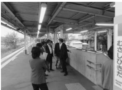
武蔵引田駅のスロープを確認

5月15日に平成24年度J R五日市線改善促進協議会総会が開催されました。平成23年度活動報告、24年度事業計画・予算などを決定後、武蔵増戸駅、武蔵引田駅及び東秋留駅のバリアフリー化改善状況を視察しました。