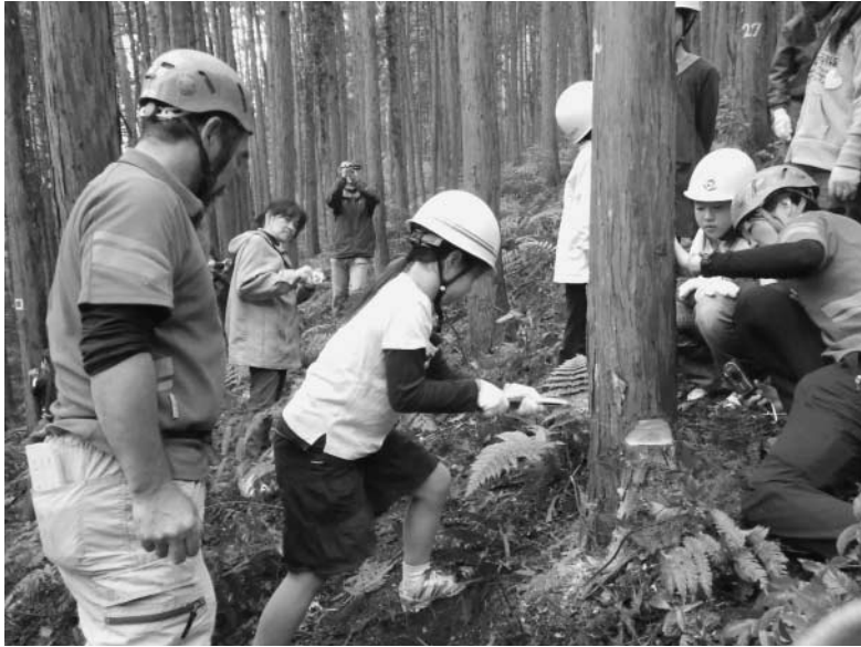
森の子コレンジャーの活動

問 小宮ふるさと自然体験学校について 平成24年3月に廃校となつた小宮小学校を利用し、自然体験学校事業が計画され実施に移ろうとしている。地元説明が行われたと聞いているが、要綱など未整備