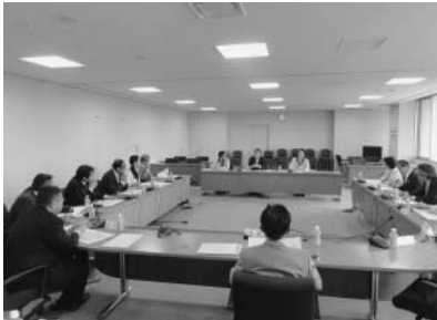
東京都から建設進捗状況を聞く

秋川南岸道路は、檜原村本宿からあきる野市上代継間を東西に結ぶ幹線道路で、檜原街道及び五日市街道の代替ルートとして地域の防災性の向上、観光シーズン時の渋滞緩和や地域経済の活性化を図ることを目的に建設が進んでいます。5月8日に総会が開催され東京都から進捗状況の説明を受けました。促進協議会では、毎年8月に東京都に対し要望活動を実施しています。