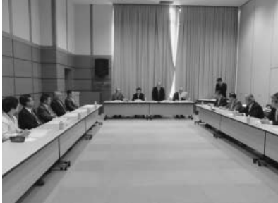
檜原村役場での総会

5月8日に秋川流域市町村下水道建設促進協議会総会が開催され、本市議会からも6名の議員が出席しました。平成23年度活動報告、24年度の事業計画・予算が提案され承認されました。さらに、住民生活環境の向上改善を図ることなどを目的に、東京都に対し、下水道事業の補助率引上げ等を、要望することが決まりました。