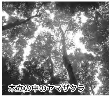
木立の中のヤマザクラ (杉野)

季節外れのサクラの話 市内の丘陵を歩いていると、とてもサクラが多いと感じます。このことはたびたび森林レンジャーがゆくに書きましたが、やはりヤマザクラを中心にたくさんサクラが見られることが市内の丘陵の特徴です。すべてのサクラを直接見に来たわけではないので、測る域を出ませんが、株立ちのサクラが多く、かつて薪や炭に利用するために切られたと思われる。コナラやサクラは切り株から再生(萌芽更新)する力が強く、切られても再生する樹種です。そのため、秋川や菅生の丘陵では、薪や炭に雑木林を利用してきた結果、これらの高木が優先的に再生して残ったものと考えられます。 秋川丘陵(サマールランドの南側)コースの尾根道(3キロ弱)を歩きながら、目視で273本ほどのサクラを確認しました。本来のサクラの樹形は、浅いスーパースピンドルにかぶせられた半球形の樹冠を作る木ですが、尾根道周辺の林内では周りのコナラなどに挟まれ、竹ぼうきを逆さまにしたような樹形(被圧による樹形の極端な乱れ)で、枝数も少なく、大きな樹冠を作れていません(樹冠閉塞)。当然、花数も少なくなっています。 秋川丘陵以外にも、金比羅尾根、菅生丘陵などのサクラも同様の状態にあります。サクラの周りの競合する木々を管理して健全な樹形が維持できるようにすると、サクラの花を楽しめる所がもっと増えると考えています。また、ヤマザクラなどは、ソメイヨシノと違