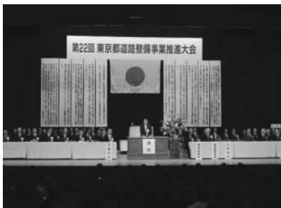
日比谷公会堂での大会

平成23年10月27日に東京23区39市町村が対象となる第22回東京都道路整備事業推進大会が日比谷公会堂で開催され、本市議会議員も参加しました。この大会は東京の交通渋滞の緩和や、安全で快適なまちづくりに資するため、道路などの整備促進を図ることを目的としています。