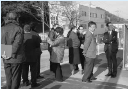
町区域の変更箇所