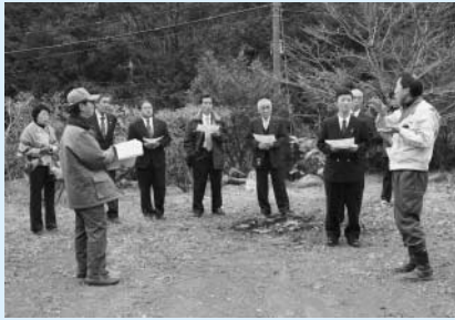
寺岡自治会内の地滑り警戒区域付近