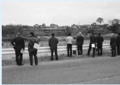
山田急傾斜地工事箇所を対岸から視察

平成23年12月6日に開催された総務委員会において、「寺岡自治会内の地滑り警戒区域」「山田急傾斜地工事箇所」の現地視察を行いました。