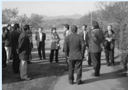
武蔵引田駅北部居住地付近

平成23年12月7日に開催された環境建設委員会において、付託された議案の「町区域の変更箇所」と陳情にかかる「武蔵引田駅北部居住地」の現地視察を行いました。