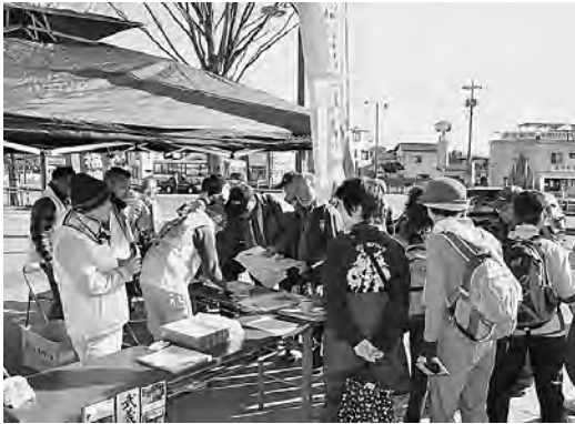
新春恒例の武蔵五日市七福神めぐりが1月1日から3日まで開催され、多くの人で賑わっていました。(1月2日)