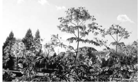
秋留台公園は、孫娘が小 さい時によく散歩に出かけ た場所です。日曜日や祝日 は、子ども連れの家族が多 くて賑やかです。子どもた ちの伸び伸びと遊んでいる 姿は、とても健全です。

景色も良く、四季を通じ ての花々も楽しむことがで きます。春の桜からはじま り、バラ、ツツジ、コスモ スと色々な花に出会いま す。また、晩秋からピンク 色の花を咲かせる皇帝ダリ ヤの花もあります。 天気が良いので散歩を兼 ね、カメラを持って出かけ ました。目に留まったの は、空に向かって咲いてい る皇帝ダリヤの花。その光 景は見事です。一度見たら 二度見なくなる花となりま した。今年もたくさんの花 が訪れる人を迎えてくれる と思います。 近くにすばらしい公園が あってとても良かったです。 草花 加藤江美子