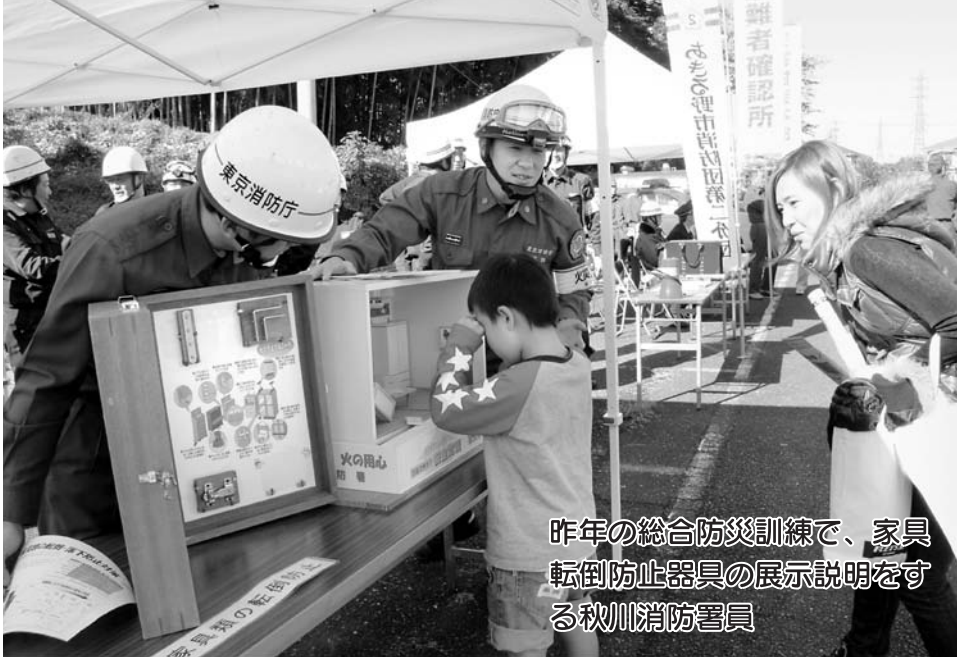
昨年の総合防災訓練で、家具転倒防止器具の展示説明をする秋川消防署員