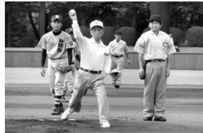
高校野球大会西東京予選を、あきる野市民球場で開催。教育長が始球式を行いました。(7月4日)