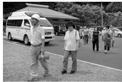
土砂災害情報伝達訓練を、乙津自治会と青木平自治会区域(小宮地区)で行いました。(6月20日)