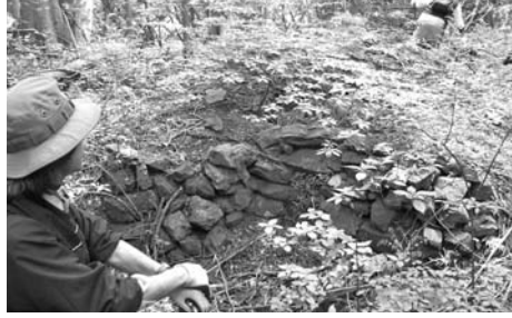
サルギ尾根 炭窯跡

森林レンジャーがゆく (2) 炭焼きと里山 里山の話として、炭焼きが語られることが多くありますが、これまで目にした古い炭窯跡は、養沢神社から大岳に向かうサルギ尾根、松原村近くのオオカミ谷、盆堀の奥のクリノキヨウなど、里山とは呼ばれ