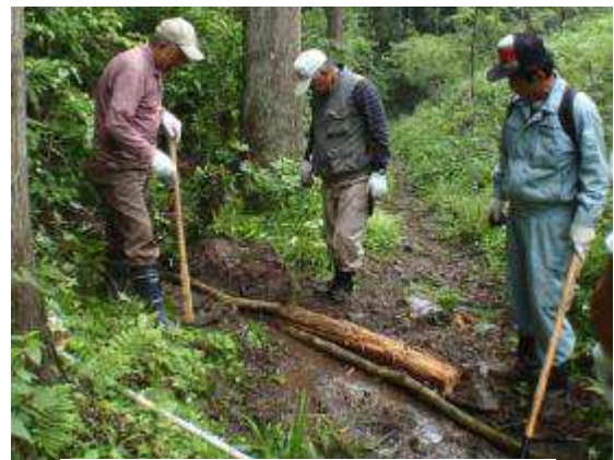
砂利や木を敷き水切り施工