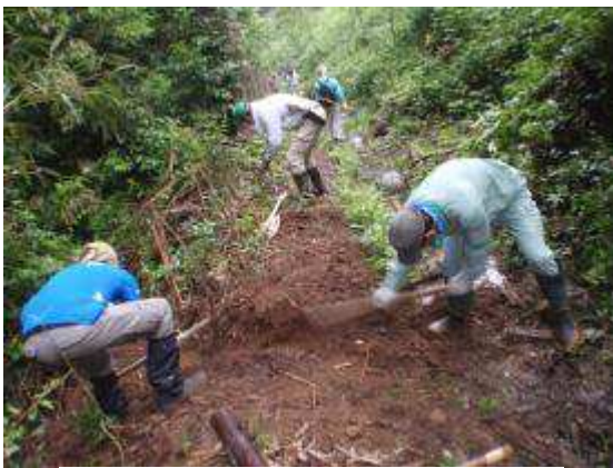
水切りのための溝掘り