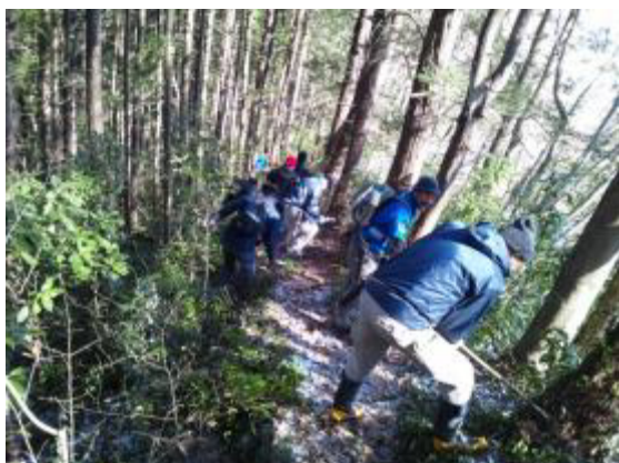
草刈り作業と尾根道の整備