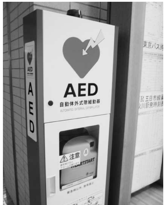
本庁舎内に設置しているAED