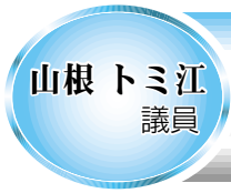
山根 トミ江 議員