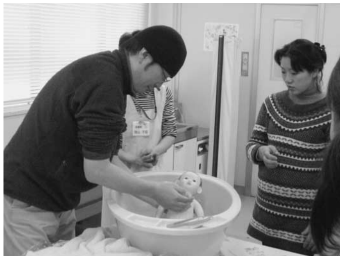
市主催事業での沐浴指導

健康福祉部長 ① 土曜日コースは半日制で年に4回開催しており、体験実習や、図書館員による絵本の読み聞かせ等を実施している。図書館などの意見も聞きながら実施に向けて検討していきたい。 ② 形態の相違もあるので、事業内容の見直し等を検討しながら実施していきたい。 ③ 現在実施している妊婦のコミュニティの場として「ハッピーベビークラブ」と妊婦及び生後1歳未満の乳児がいる保護者を対象とした「ここにこくッキング講座」があるが、今後も市民のニーズに合わせた場の提供に向け検討していく。 他に、旧秋川高校跡地利用について(その2) 質問