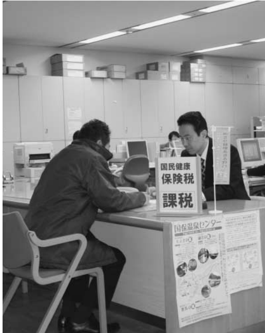
国民健康保険税の相談

問 国民健康保険税の引き下げを 国民健康保険財政が赤字になる中、各地で値上げが行われている。安心して医療にかかれるよう高い国民健康保険税の引き下げを求め、以下質問する。