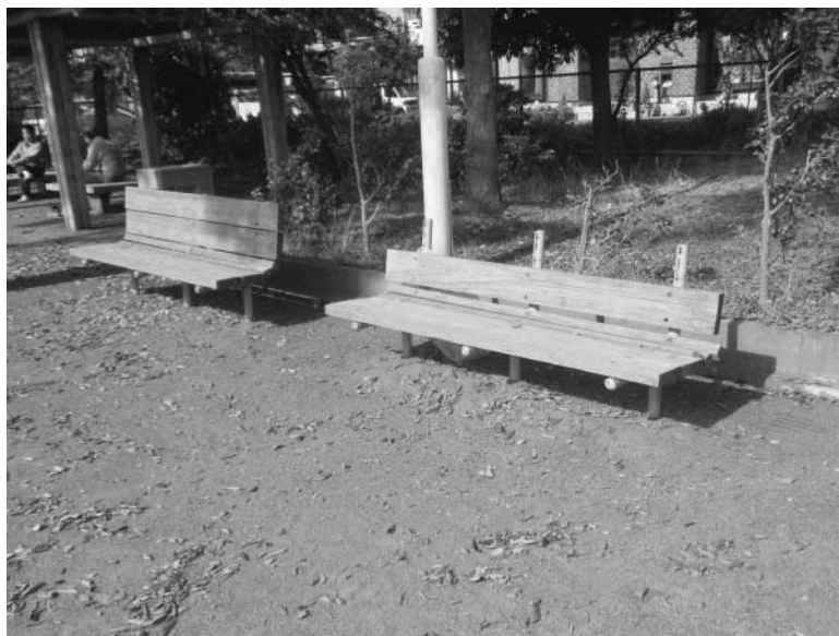
公園内の壊れているベンチ

問 安心安全まちづくり ① 公園の維持管理はどの様に行われているか。 ② 今の公園コンセプトは、危ない公園、また、管理の行きとどかない公園となってしまうのではないか。 ③ 32か所の公園を見た現