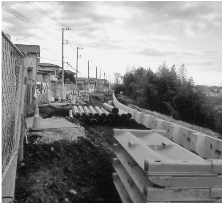
工事の進む都道29号線

問 草花周辺を走る都道について ① 都市計画道路秋3・3・9号線と、いづみ通りとの交差点の進捗状況は。また、白地地区についての対応はどうなっているか。 ② 秋3・4・6号線の進捗状況と今後の見通しは。また、事業説明会はいつ頃に開かれるのか。