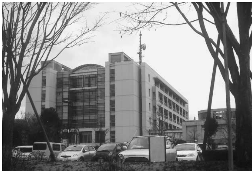
行政改革を進めるあきる野市（本庁舎）

歳入確保の見地から、「差押え」や未利用市有地の売却等、今後の具体的な施策を伺う。