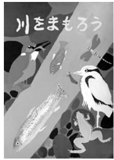
長野暁さんの作品

日時 11月14日(土)～23日(日) 場所 あきる野ルピア1階フードコート広場