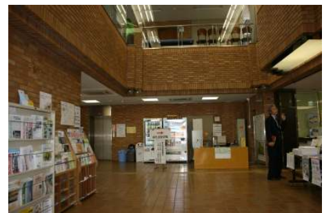
⑧待合スペースより