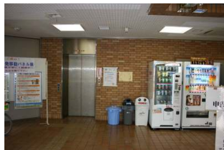
⑪玄関付近(エレベーター等)