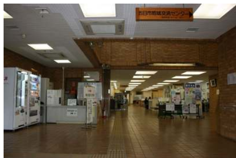
⑨玄関付近から見た1階の様子