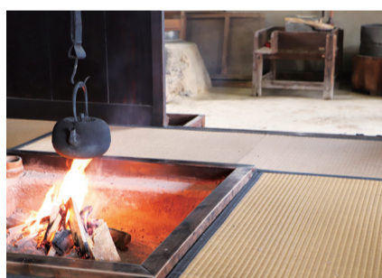
旧市倉家住宅の囲炉裏

このように思うと、「未来の人々に何を伝えたいのか」と考えてしまいます。みなさんは未来のあきる野に生きる人々に、何を伝えたいと思いますか。