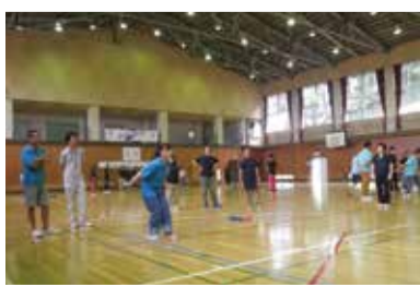
ボッチャ体験研修

青少年委員が青少年指導や健全育成に活かすため、研究・研修活動を企画・実施します。他市町村の青少年施設などの視察や青少年に関する調査など毎年異なる研修を企画し、活動への糧としています。