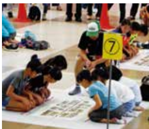
カルタ大会の様子