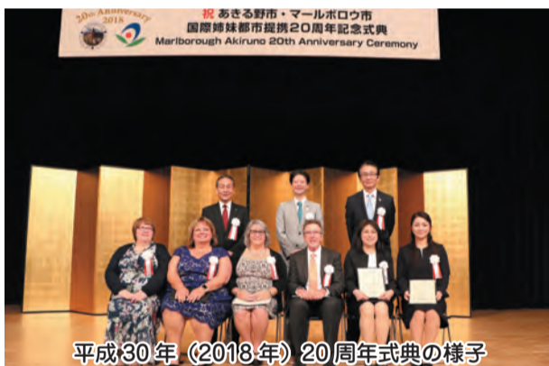
平成30年(2018年)20周年式典の様子

平成10年に、マールボロウ市長をはじめとする友好訪問団が来日し、正式に姉妹都市提携の共同宣言を行いました。そこから、派遣と受入の両方を行う交流事業を実施しています。今年度は、国際姉妹都市提携から25周年となります。