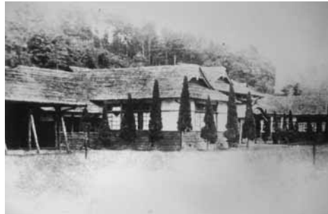
大正3年頃の旧戸倉小学校 「五日市の百年 (写真集)」より