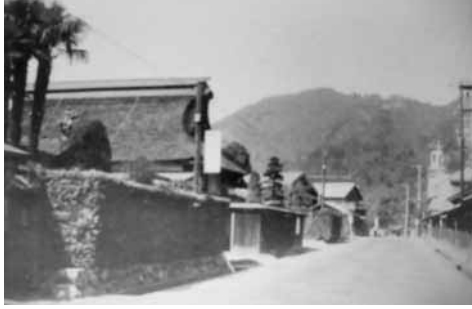
戸倉本郷通り (年代不詳) 「五日市の百年 (写真集)」より

光厳寺は臨済宗建長寺派で、建武元年(1334)に足利尊氏により創建されたと伝えられています。都指定有形文化財の