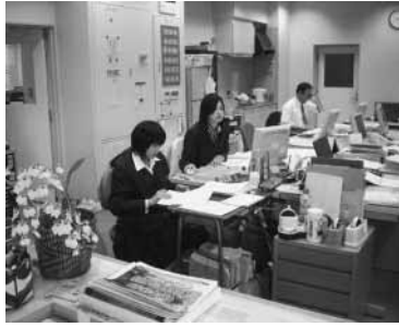
秋川体育館での職場体験学習 (東中学校)

平成20年度に中学生の受け入れにご協力をいただいた事業所等をご紹介します。(順不同・敬称略)