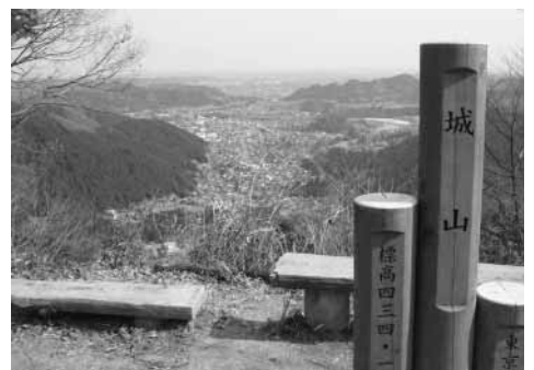
城山山頂からの眺望