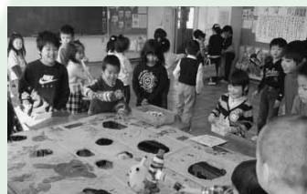
小学校と幼稚園・保育園の交流活動

子どもに対する一貫性のある指導を行うために、幼稚園、保育園と小学校、小学校と中学校の連携を重視した教育を研究・推進します。