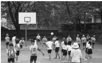
3校交流授業（クラブ活動）