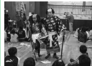
伝統・文化ワークショップ

基礎的・基本的な学力の定着及び向上を図り、子どもの自ら学び、自ら考える力を伸ばすために、個に応じた多様な教育を推進します。