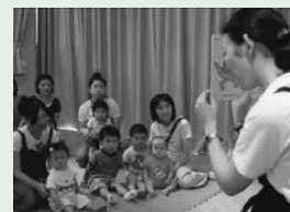
図書館での本の読み聞かせ

子どもが本に親しみ、豊かな言葉と考える力、やさしい心をはぐくむ読書活動の推進を通じた市民の読書環境の整備を図ります。