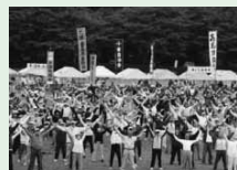
市民スポーツレクリエーション大会

スポーツ施設の整備や指導者及び団体の育成と、スポーツ・レクリエーションに関する情報の提供を行い、東京国体開催にむけた準備を進め、市民スポーツの振興を図ります。