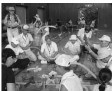
放課後子ども教室

家庭、学校、地域社会、関係機関の連携を図り、その教育力を活用し次代を担う子どもたちを育成します。