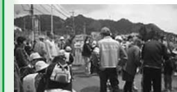
学校ボランティアの活動

家庭・地域社会と連携した教育を目指し、保護者や地域住民による学校支援の仕組みづくりを進め、開かれた学校づくりを推進します。