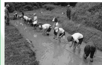
小学生の米づくり体験学習

郷土の豊かな自然環境とのかかわりを通して、自然を大切にすることをはぐくむとともに、地球環境の保全について考え、行動できるような環境教育を推進します。