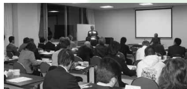
学校安全ボランティア講習会

『学校の安心・安全対策』の徹底を図り、子どもたちが安心して安全に生活できる学校や地域の環境づくりを進めます。