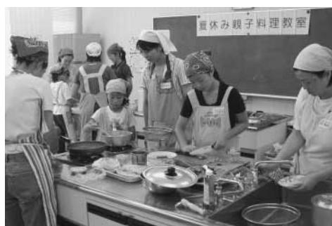
真剣に料理に取り組む子どもたち

8月9日から11日の3日間、今年で2回目となる夏休み親子料理教室を開催しました。テーマは「バランス弁当を作る」今回は、参加対象を小学生の4年生から6年生に広げ、昨年を大きく上回る、22組44名の親子が参加し、子どもでも簡単に作ることができる、栄養バランスを考えたお弁当のおかず6品を作ることに挑戦しました。参加者ほどの作業も真剣。初めて厚焼き卵を上手に作り上げる子どもたちの姿に、一緒に参加のお父さん、お母さんも驚きの表情。持参のお弁当箱に、彩りあふれるおかずをつめていく姿が楽しそうでも印象的でした。