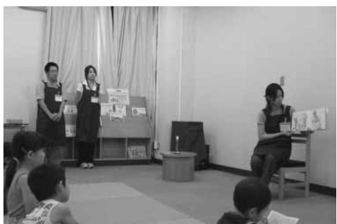
子どもたちへの読み聞かせにも挑戦

今回の「夏休み親子料理教室」も、昨年以上に充実した教室となりました。終了後のアンケートでも「来年も参加したい」との感想を数多くいただきました。その意見や感想を参考に、来年はさらに実りある内容にし、より多くの子供たちに料理づくり体験を通して、料理の楽しさ、食の大切さを伝えていきたいと思えます。