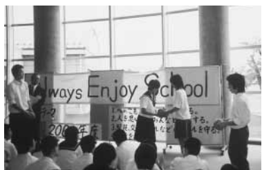
16校の中学校生徒会の代表が交流

生徒会交流では、栗原市から10校、あきる野市からは6校の代表が、生徒会の活動などについて活発な討論を行いました。