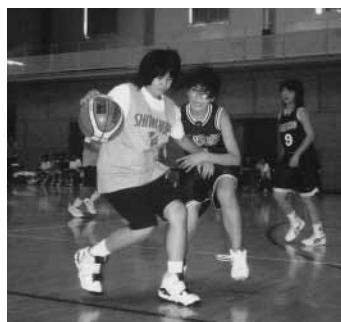
熱戦を繰り広げた部活動交流

これらの事業は、職場体験を通じて図書館業務の理解を深めるとともに、働く意義を学ぶ機会を提供するものです。カウンターでの本の貸出し、返却業務はもちろんです。さまざまな裏方の仕事も経験し、一見きりで楽な仕事に映る図書館員の仕事は、実は体力勝負のきつく汚れる仕事であることも体験しました。