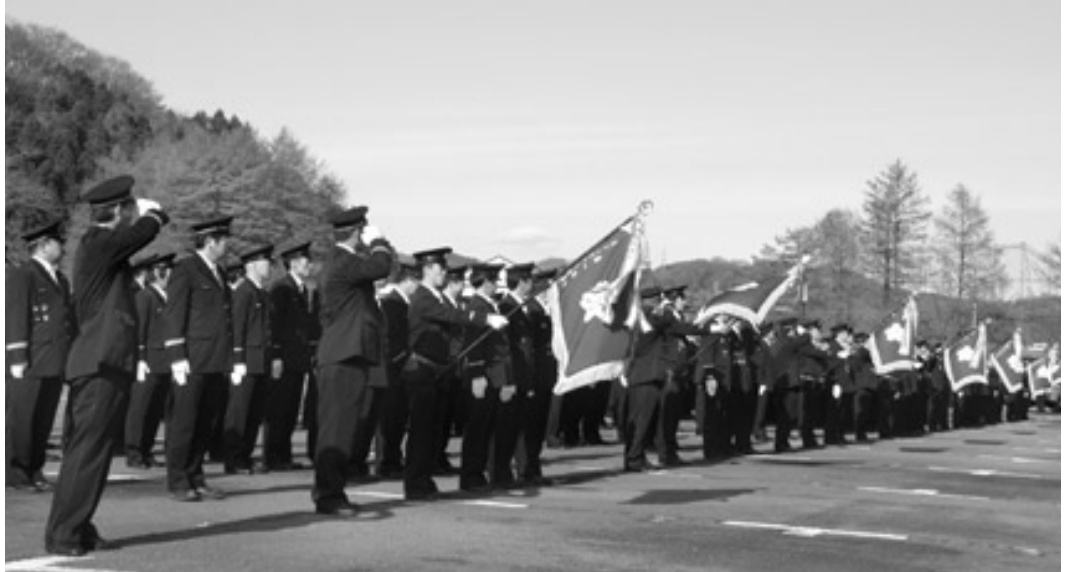
1月13日に、消防団出初式が、東京サマーランドファミリーパーク駐車場で行われました。

火災発生時のサイレンが鳴り、出動区域であれば昼夜を問わず、いち早く現場に駆けつける消防団員。市内には7つの消防団があり、現在、459人の団員が自身の仕事をしながら地域防災のため活動しています。 火災の消火活動や台風などの自然災害での活動のほか、火災予防運動期間や歳末に特別警戒活動を行っています。また、消防操法訓練を一定期間、夜間にほぼ毎日に行ったり、消防署が主体となる水防訓練、救急訓練などへの参加や器具の定期的な点検整備を行い、市民の生命と財産を守るため奉仕の精神を持ち、努力しています。 「愛着のある自分のまちを自分たちで守りたい」と団員たちの熱い思いが地域を支えています。 市では、町内会・自治会の協力を得て、「防災・安心地域委員会」を近く発足させ、地域力の強化を図っていきます。