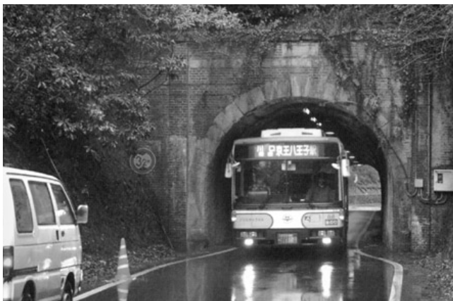
すれ違いのできなかつたトンネル

近世以来、五日市と八王子との関係は密接不可分で、五日市地方は八王子を中心とする経済圏の北辺を形成していました。特に、幕末以来、生糸や黒八丈織を通じて、更に明治後期より大正期にかけては、製糸や織物業を通じて、結合は一層深まってきました。五日市・八王子間は約四里（16キロメートル）であり、日帰り往復の距離にありました。ただし、秋川南岸沿いに走る丘陵を越えなければならず、通常最も多く利用されたのが、小峰峠でした。日清戦争の戦勝景気は五日市地方にも及び、人や物資の動きが一段と活発になると、五日市・八王子間の乗合馬車の会社が誕生しました。しかし、難所である小峰越えでは馬の疲労が激しく、健全な経営を行なうことが困難になりました。大正期になり、自動車が輸入されるようになると、かねてより建設中であった小峰トンネルの完成を機に、五日市・八王子間を乗合自動車の営業が開始されました。その後、五日市の「五」と八王子の「王」と取り「五王自動車商会」という商号を名乗り、時流にのって、バス路線網を発達させていきました。五日市を中心に放射線状にバス路線を広げ、秋川流域住民の欠くことのできない足として発展していくこととなりました。