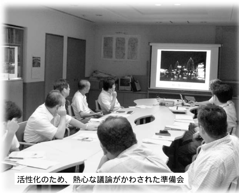
活性化のため、熱心な議論がかわされた準備会