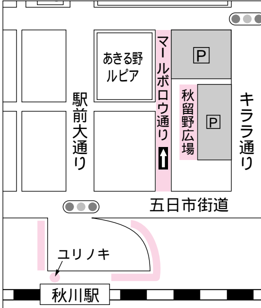
イルミネーション点灯範囲