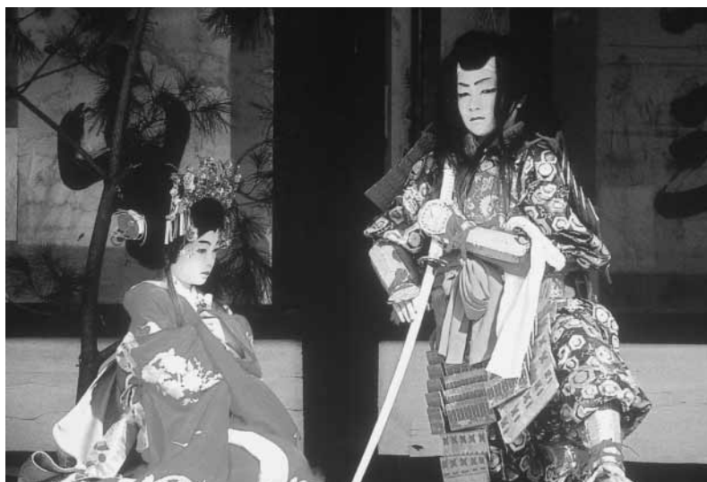
全国各地芝居サミットでの子ども歌舞伎