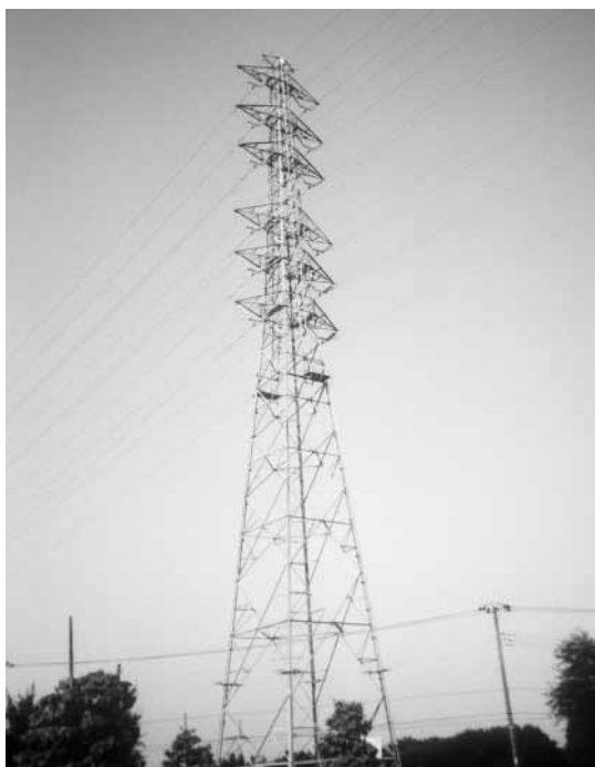
東京電力の送電線