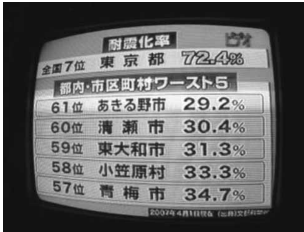
東京都の学校耐震化率を放映するテレビ

しかしながら新耐震基準にする必要はあり、国を上げてその方向に向かっていく。財政の確保には国や東京都に訴えて努力していく。