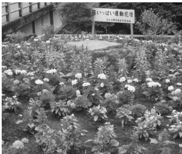
花いっぱい運動の花壇

地域力を活かした景観整備について、市民の健康志向の高まりとともにウォーキングが親しまれている。圏央道の下にある平井川沿いには梅の木が植えられ、春には花が咲き乱れる。そ