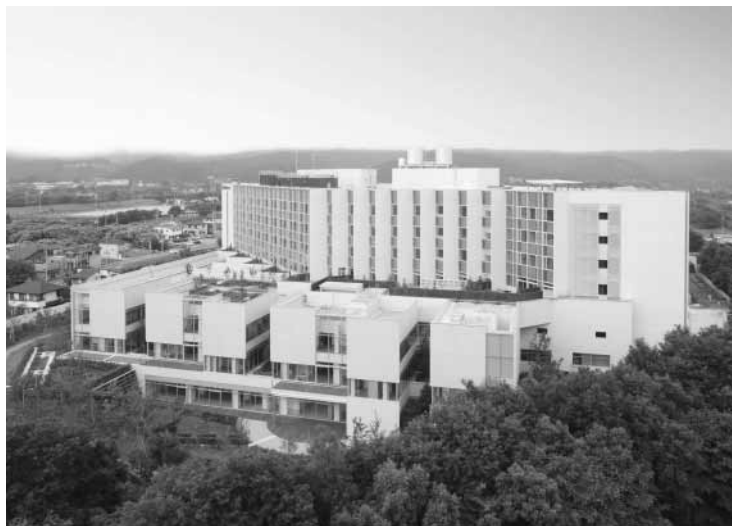
公立阿伎留医療センター